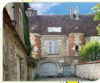
9 Maison Jean Cocteau

Temps de visite : 1h avec jardins Renseignements : 01 64 98 11 50 Site : www.jeancocteau.net