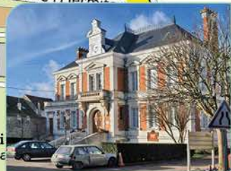
13 Hôtel de Ville