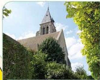
10 Église Notre-Dame

Temps de visite : 1h avec jardins Renseignements : 01 64 98 11 50 Site : www.jeancocteau.net