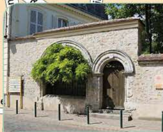
14 Porte du Moustier de Péronne