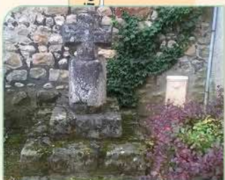
6 Croix Saint-Jacques

Temps de visite : 30 min Renseignements : 01 64 98 84 94 Site : www.chapelle-saint-blaise.org