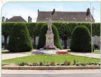
4 Place Gallieni