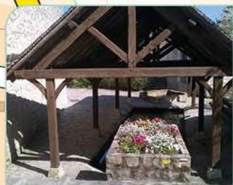
12 Lavoir du Coul' d'eau