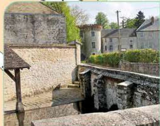
11 Lavoir de la Bonde et Château

Office de Tourisme de Milly-la-Forêt Vallée de l'École, Vallée de l'Essonne 01 64 98 83 17 - www.millylaforet-tourisme.com