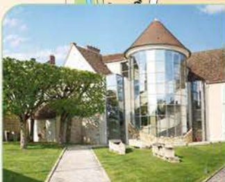
8 Espace Culturel Paul Bédou

Temps de visite : 30 min, entrée libre Renseignements : 01 64 98 75 52 Site : www.milly-la-foret.fr