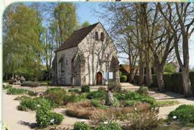
5 Chapelle Saint Blaise

Temps de visite : 30 min Renseignements : 01 64 98 84 94 Site : www.chapelle-saint-blaise.org