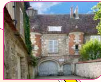
9 Maison Jean Cocteau

Temps de visite : 1h avec jardins Renseignements : 01 64 98 11 50 Site : www.jeancocteau.net