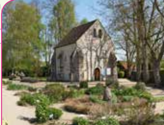
5 Chapelle St-Blaise-des-Simples

Temps de visite : 30 min Renseignements : 01 64 98 84 94 Site : www.chapelle-saint-blaise.org