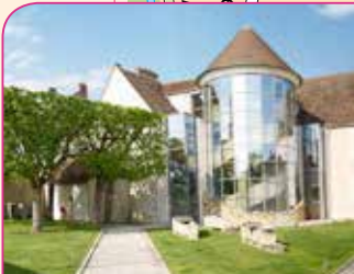
8 Espace Culturel Paul Bédou

Temps de visite : 30 min, entrée libre Renseignements : 01 64 98 75 52 Site : www.milly-la-foret.fr