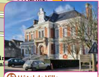
13 Hôtel de Ville