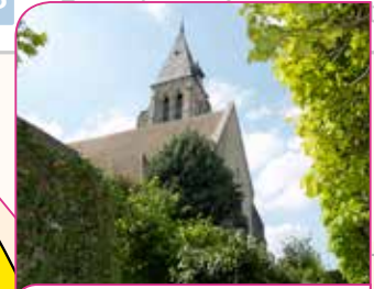
10 Église Notre-Dame

Temps de visite : 1h avec jardins Renseignements : 01 64 98 11 50 Site : www.jeancocteau.net