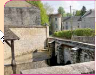
11 Lavoir de la Bonde et Château

Office de Tourisme de Milly-la-Forêt Vallée de l'École, Vallée de l'Essonne 01 64 98 83 17 - www.millylaforet-tourisme.com