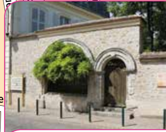
14 Porte du Moustier de Péronne