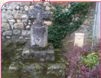
6 Croix Saint-Jacques

Temps de visite : 30 min Renseignements : 01 64 98 84 94 Site : www.chapelle-saint-blaise.org