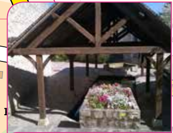
12 Lavoir du Coul' d'eau