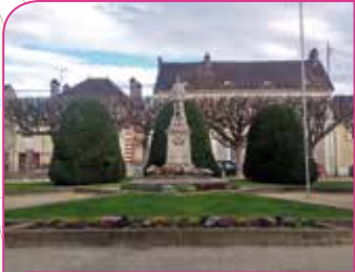
4 Place Gallieni